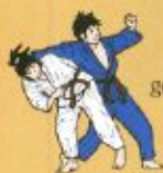
Hüftdrehung gegen Uchi-mata

Verteidigen durch Blocken gegen zwei verschiedene Eindrehetechniken